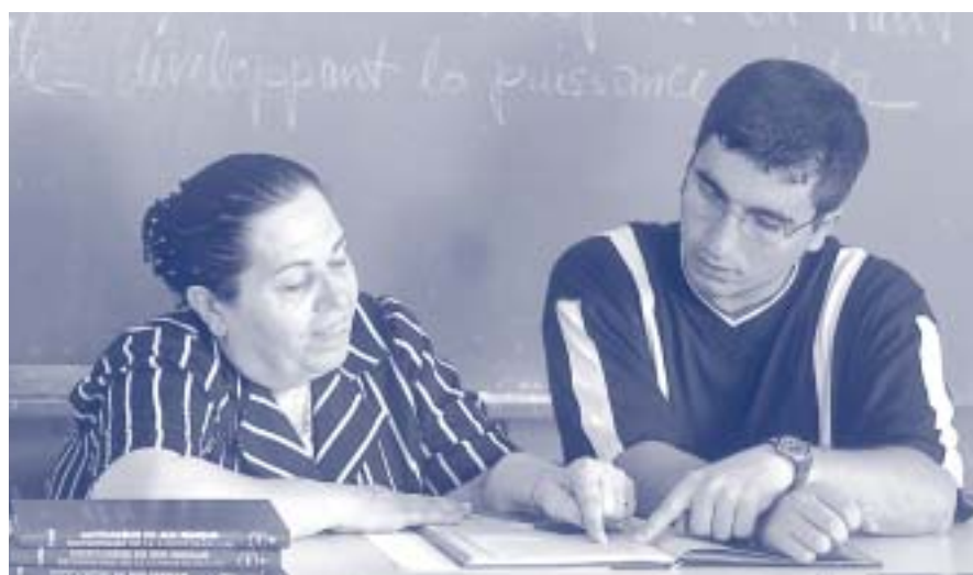
El programa UNILIT representa un puente entre los privilegiados jóvenes universitarios y las comunidades pobres.