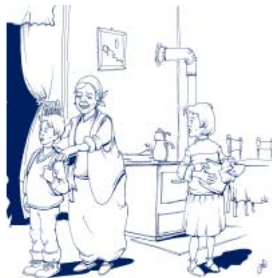
del libro de texto utilizado en el programa de alfabetización de Kosovo.

Contactos: U. Hanemann y M. Elfert, IEU, Hamburgo; e mail: u.haneman@unesco.org y m.elfert@memo.unesco.org