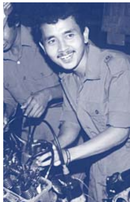
Nuevo intento por reconocer las destrezas de personas sin calificaciones formales.

Contact: Mohan Perera, UNESCO París e-mail: m.perera@unesco.org